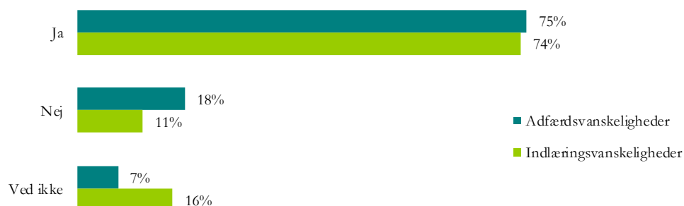
Figur 1: Er der efter din opfattelse børn i dit barns klasse, der har adfærds- eller indlæringsmæssige vanskeligheder, som lærerne skal tage særlige hensyn til?