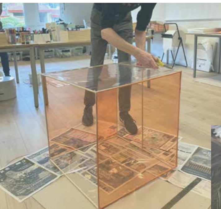
Billeder fra fagkurser i billedkunst, udbudt af Danmarks Lærerforening.

De gennemførte aktiviteter er blevet mødt med høj efterspørgsel og belægningsgrad på de udbudte fagkurser. I kursusevalueringerne for de gennemførte fagkurser ses desuden en høj grad af tilfredshed blandt de deltagende medlemmer med en klar indikation af, at formatet for fagkurserne rammer et udækket behov, og at kvaliteten og relevansen vurderes at være høj. Med de p.t. gennemførte og planlagte aktiviteter (fagkurser, øvrige uddannelsesforløb samt dagsseminarer) tilbydes efteruddannelse til i alt ca. 4000 lærere/børnehaveklasseledere m.fl.